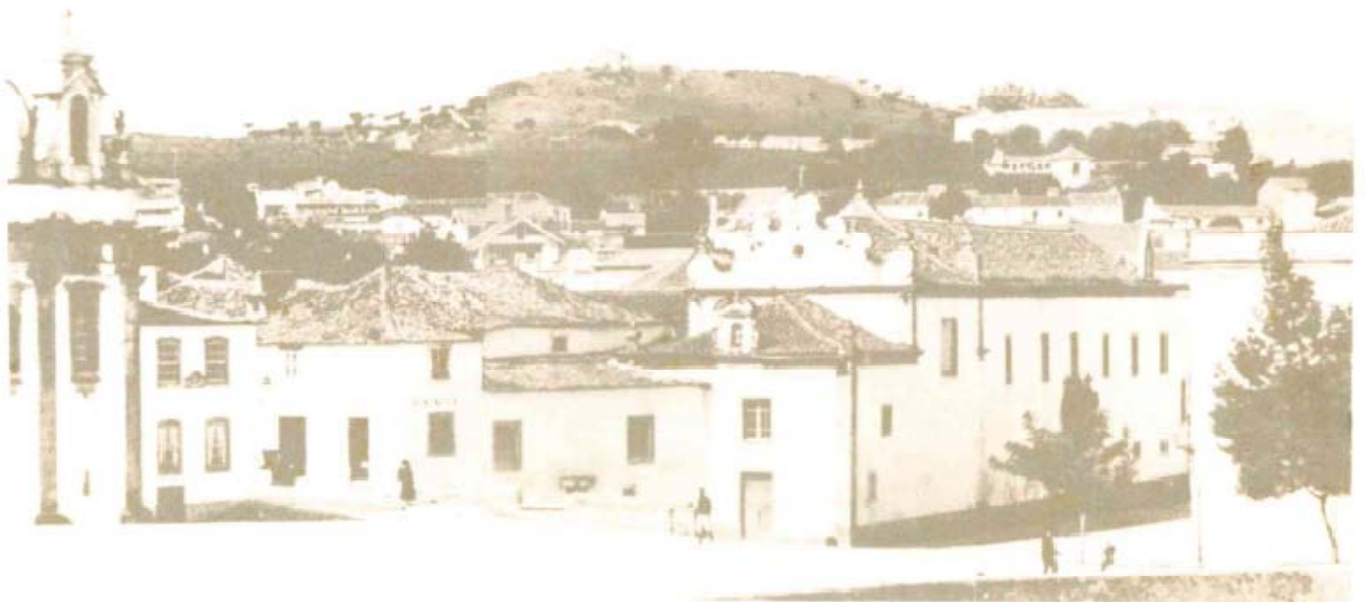
Ilustração 1 | Igreja do espírito Santo (Torre à Esquerda), Mercado Santana, Banco Nacional Ultramarino