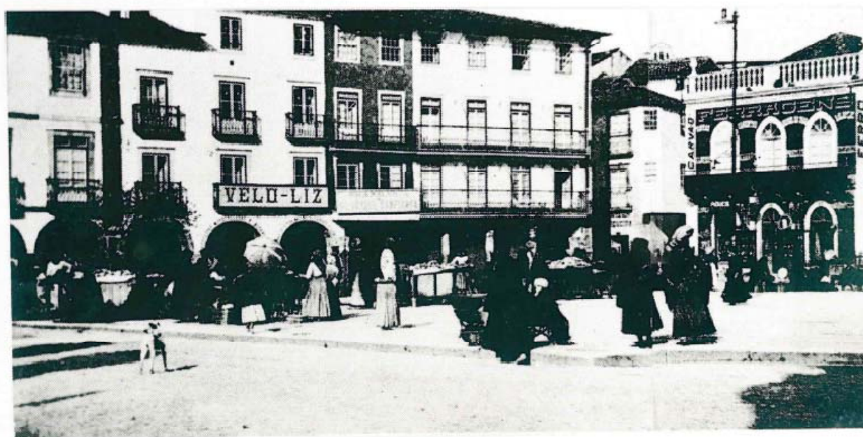
Ilustração 2 | vista parcial da Praça Rodrigues Lobo

Município de Leiria - Arquivo Municipal de Leiria Rua da Cooperativa – 2414-019 S. Romão – Leiria Tel: 244 839 668 email: amlra@cm-leiria.pt